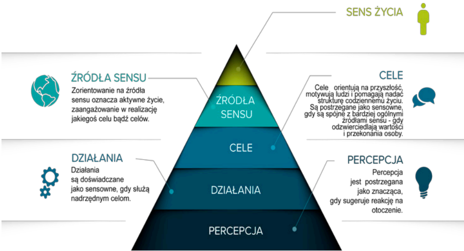
Schemat 1. Hierarchiczny model sensu życia.